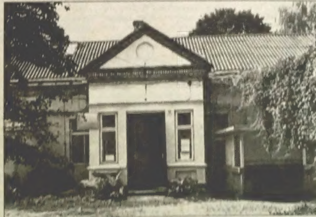
Дзён з дамак ТБК, куды прыходзілі дэлегаты.